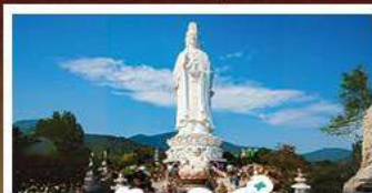
วัดเล่ินอึ้ง