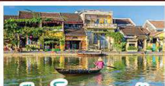
เมืองโบราณเฮืองอัน

! พักบานาเอซิลล์ 1 คืน ! สัมผัสอากาศเขตร้อนชื้น สตรีฟรังเศสสุดคลาสสิก - นั่งกระเช้ายาวที่สุด สูบานาฮิลล์ สนุกสุดมันส์ไปกับสวนสนุก The Fantasy Park มีบริการเช่าแม่กวนอิมองค์ใหญ่ที่สุดของเมืองดานัง - เขื่อนเมืองมรดกโลกฮอยอัน - สนุกสนานไปกับกิจกรรม!!นั่งเรือกระดัง หมู่บ้านกัมพาน เขื่อนอริณคาเฟ่ SON TRA MARINA CAFE - ไม่หลงร้านข้าว - อิ่มอร่อยกับบุฟเฟ่ต์นานาชาติ , หน้าไอซ์ฟู้ด