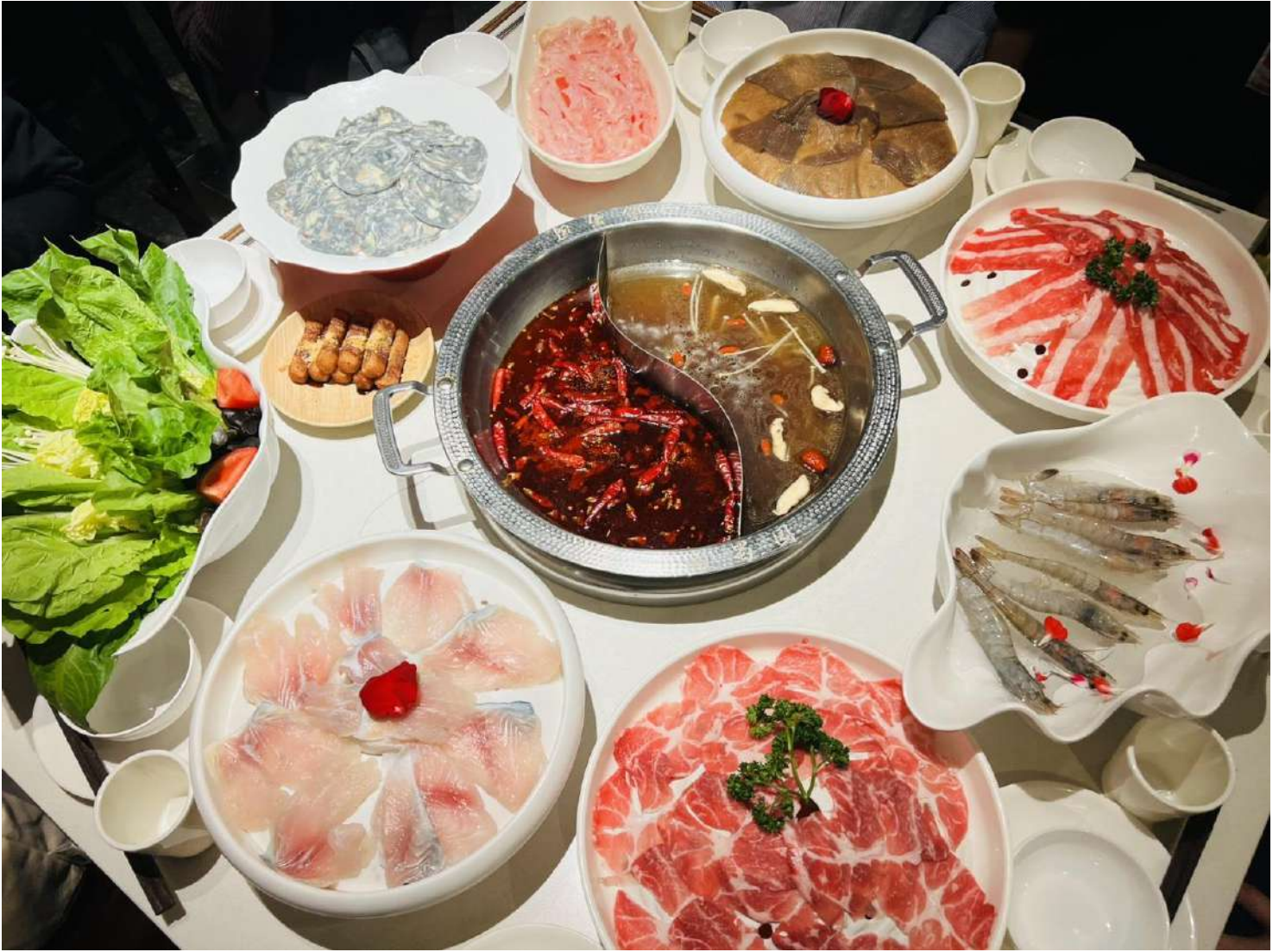
คำ รับประทานอาหารคำ ณ ภัตตาคาร (เมื่อที่ 9) *เมนูพิเศษ สุกีหมาล่าเสฉวน