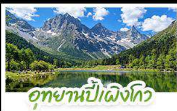
อุทยานป่าเฟิงโกว

อุทยานสัตว์รุกรณ์ • อุทยานป่าเฟิงโกว • เมืองตุเจียงเยียน รูปปั้นหมีแพนด้าบนถนนเซฟ • ร้านหนังสือจงซูเก้อ • วัดต้าอิว ถนนโบราณชอยกวางชอยแคบ • ถนนคนเดินซุนซีลู่ • ถนนไท่กู่หลี่ หมีแพนด้าปับติก IFS • ชมแสงสีน้ำพุไม้ไฟติก SKP • ชมตึกแฝดเจิงตู