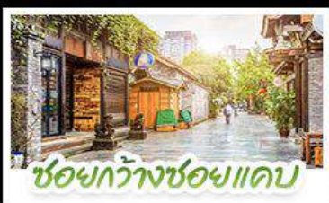
ชอยกวางชอยแคบ