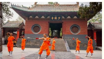
ชมโชว์กังฟูเล่าหลิน

*ทางบริษัทฯ ขอสงวนสิทธิ์ในการสลับโปรแกรมทัวร์ตามความเหมาะสมขึ้นอยู่กับสถานการณ์หน้างาน โดยคำนึงถึงผลประโยชน์ของลูกค้าเป็นสำคัญ