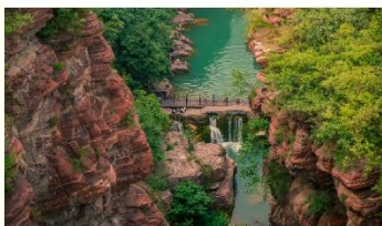
อุทยานสวรรค์หยุนโตซาน