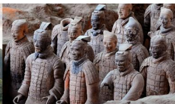
สุสานทหารจีนซี