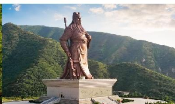
บ้านเกิดกวนอู