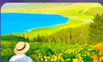
ทะเลสาบไซ่หลี่มู่