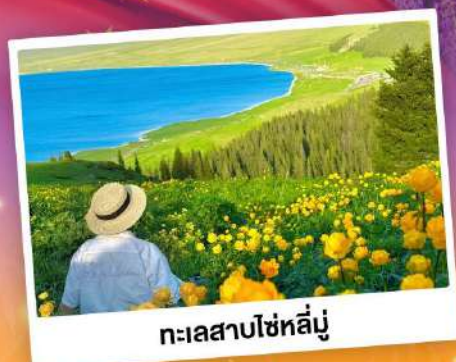
ทะเลสาบโซ่หลี่มู่

ถ่ายรูปทุ่งดอกลาเวนเดอร์ - กุ่่งหนุ่่าคาลาจัน SKY GRASSLAND กุ่่งหนุ่่ามรดกโลก