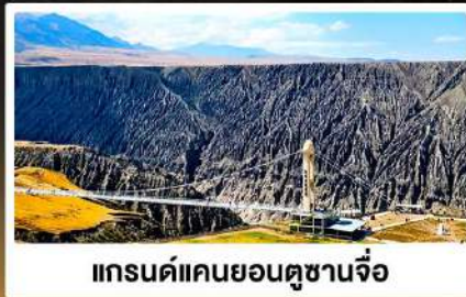
แกรนด์แคนยอนตูซซานจื่อ