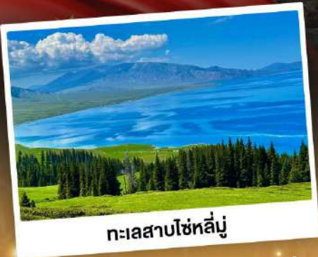
ทะเลสาบไซห์หลี่นู่

ชมวิวสุดอลังการแบบยุโรปผสมเอเชีย กุ้งหลุ่ยน้าเขียวฉ่ำ ทะเลสาบสีเทอร์ควอยซ์