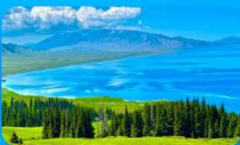
ทะเลสาบไซ่หลี่มู่