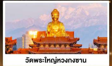
วัดพระใหญ่หวงกงซาน