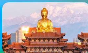
วัดพระใหญ่หวงกงซาน