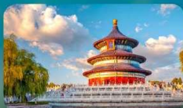
หอสักการะฟ้าเทียนถาน

LEAFIN HOTEL / GOLDEN PHOENIX หรือเทียบเท่า 4 คาว