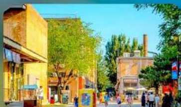
798 Art District