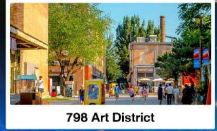
798 Art District