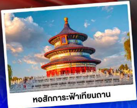
หอสังเกตการณ์เทียนถาน