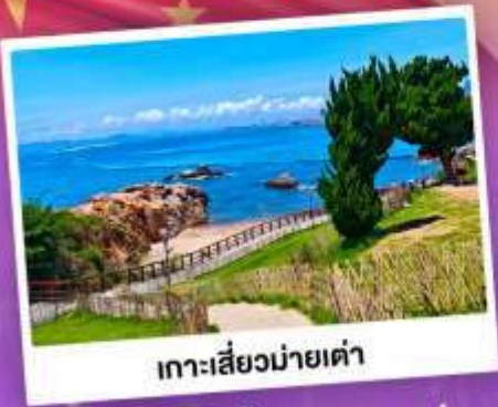
เกาะเสี่ยวมายเต่า

เที่ยวชิงเต่า เมืองทะเลสุดชิล ครบทั้งกิน เที่ยว ถ่ายรูป