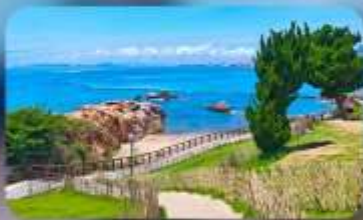
เกาะสี่เหลี่ยมเต่า