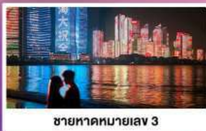
ชายหาดหมายเลข 3