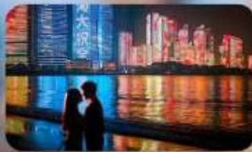
ชายหาดหมายเลข 3