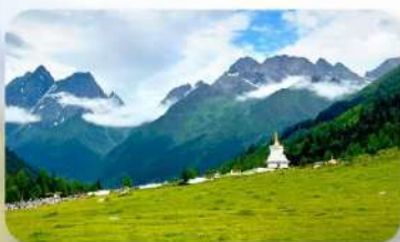
ภูเขาสี่ฤดู