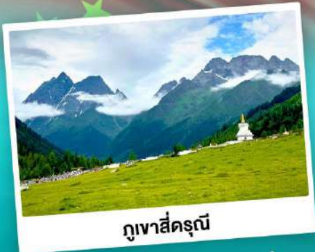
ภูเขาสิ่ดรุณี

ชมความสวยงามทุ่งหญ้าท่ามกลางเทือกภูเขาสิ่ดรุณี อุทยานย่อย "แซงกรีจ้าแห่งสุดท้าย" ส-ตบ 5A