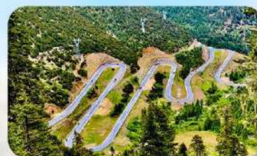
ถนน 18 โค้ง