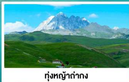
ทุ่งหญ้าท่ามกลาง