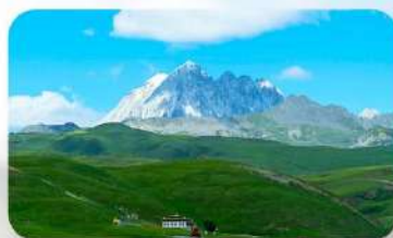
ทุ่งหญ้าด่าง