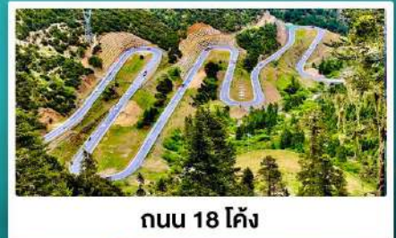
ถนน 18 โค้ง