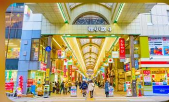
ซุปป์ิงถนนทากูกิโคจิ