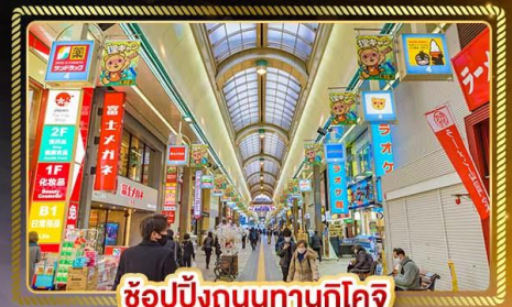
ช้อปปิ้งถนนทานุกุโคจิ