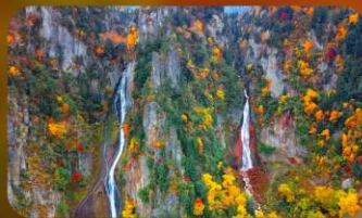
น้ำตกกิงกะ และน้ำตกริวเซ