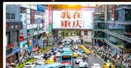
ถนนอาหารกวนอันเสียว