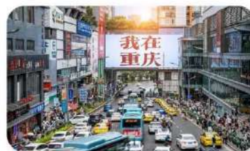
ถนนอาหารกวนอันเฉียว