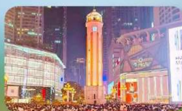
ถนนคนเดินเจี๋ยฟางเป่ย์