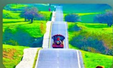
เขานางฟ้า