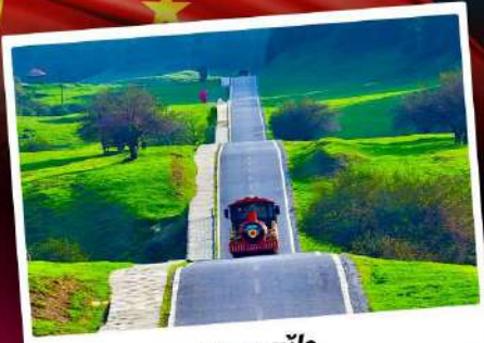
เขานางฟ้า