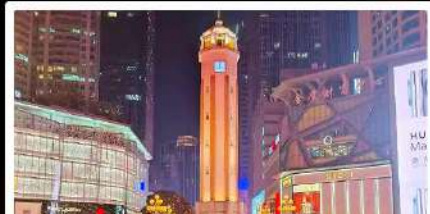
ถนนคนเดินเจียฟางเป่ย์