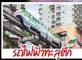
รถไฟฟ้าทะเลสาบ