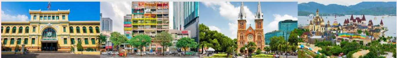
ไพรชนีย์กลางโฮจิมินห์