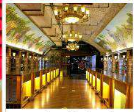
พิพรักนที่ไวน์ชิงเต่า