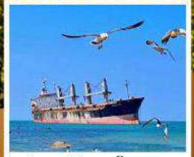
เรือสินค้าเกยตื้นบลูวีส