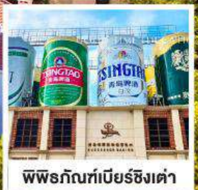
พิพรักนที่เบียร์ชิงเต่า