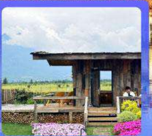
ร้านกาแฟหยุนต้ออัน