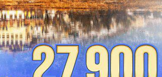
เริ่มต้น