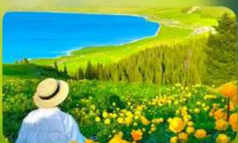
ทะเลสาบไซ่หลี่มู่