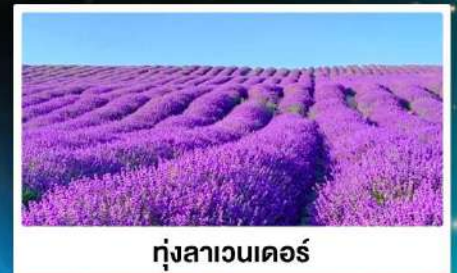
ทุ่งลาเวนเดอร์