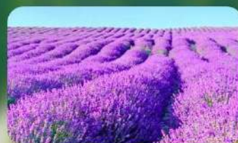
ทุ่งลาเวนเดอร์