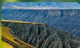
แกรนด์แคนยอนคู่ซานจื่อ