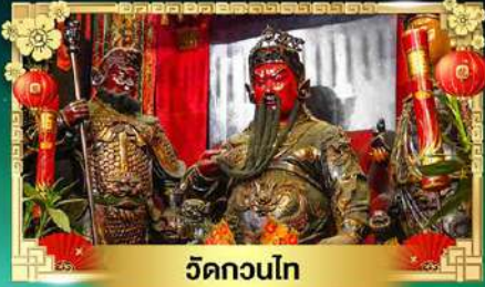
วัดกวนโต