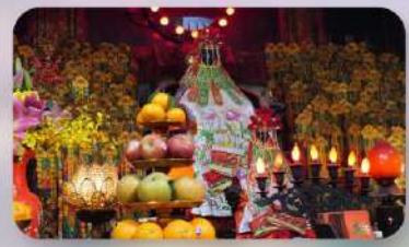
วัดกวนอิมสองฮิม