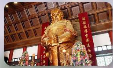
วัดกังหันแวง