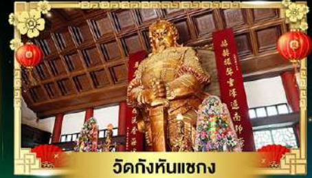
วัดกั๊งหันแซง