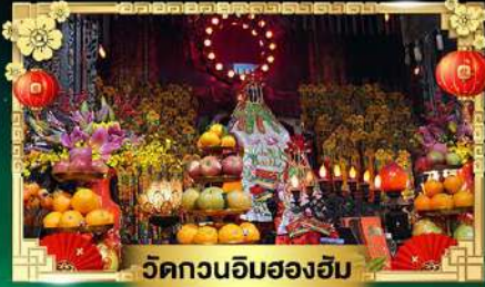
วัดกวนอิมสองอิม