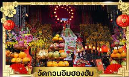
วัดกวนอิมสองอิม