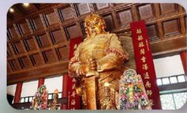
วัดกังหันแซง