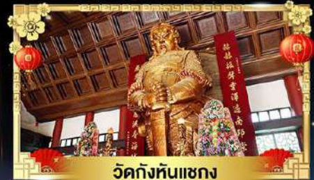
วัดกังหันเข็ก