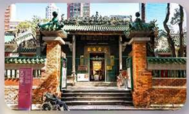
เจ้าแม่กิมกิมทิว