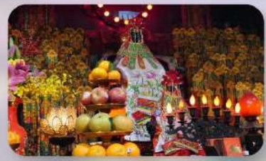
วัดกวนอิมสองฮิม