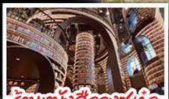
ร้านหนังสือจงซูเก้อ