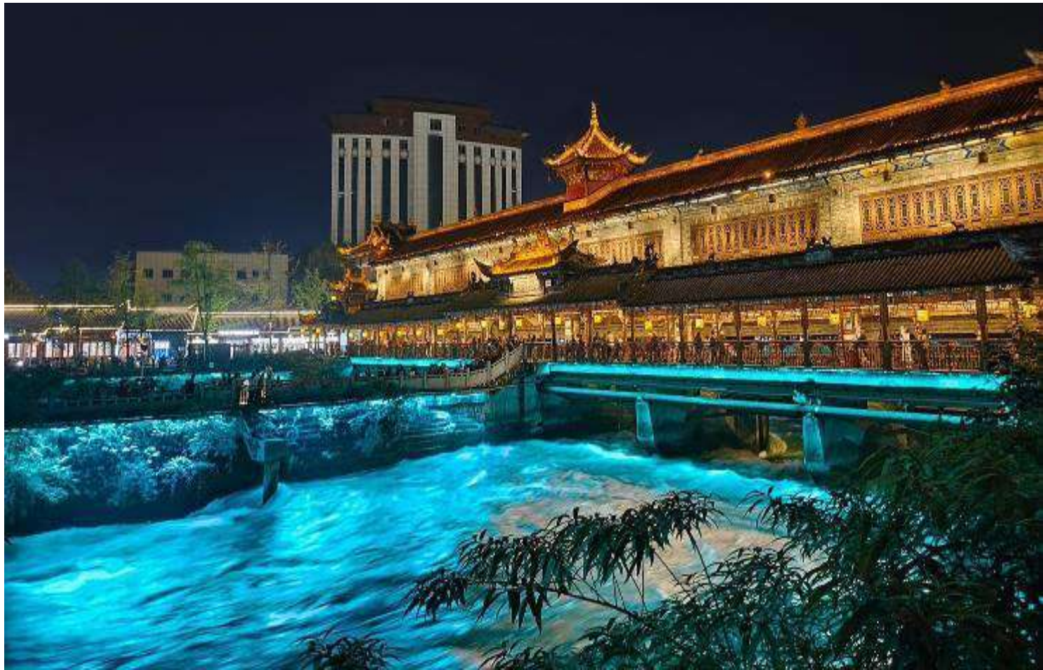
นำท่านเที่ยวชม สะพานโบราณหนานเฉียว เป็นสถานที่ท่องเที่ยวขนาดใหญ่ที่มีริมเป็นน้ำ ในโครงการอนุรักษ์น้ำตูเจียงเยียน ซึ่งเป็นมรดกทางวัฒนธรรมของโลก โดยผสมผสานเทคโนโลยีสมัยใหม่เข้ากับวัฒนธรรมการอนุรักษ์น้ำโบราณครอบคลุมพื้นที่กว่า 1,000 เอเคอร์ หากได้ไปในเวลากลางคืนท่านจะได้ชมวิวแห่งนี้คือการแสดง แสงและเงา "น้ำตาสีฟ้า" น้ำตาสีน้ำเงินเป็นจุดลึกลับเรื่อง