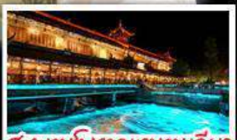
สะพานโบราณหนานเฉียว