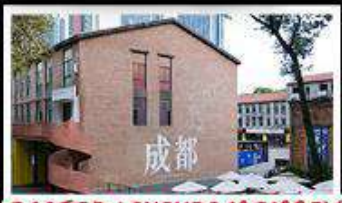
EASTERN SUBURB MEMORY