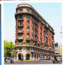
ถนนอู๋คิง