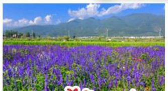
สวนดอกไม้ฮาวอวี่มู่ฉ่าง