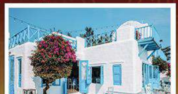
SON TRA MARINA CAFE