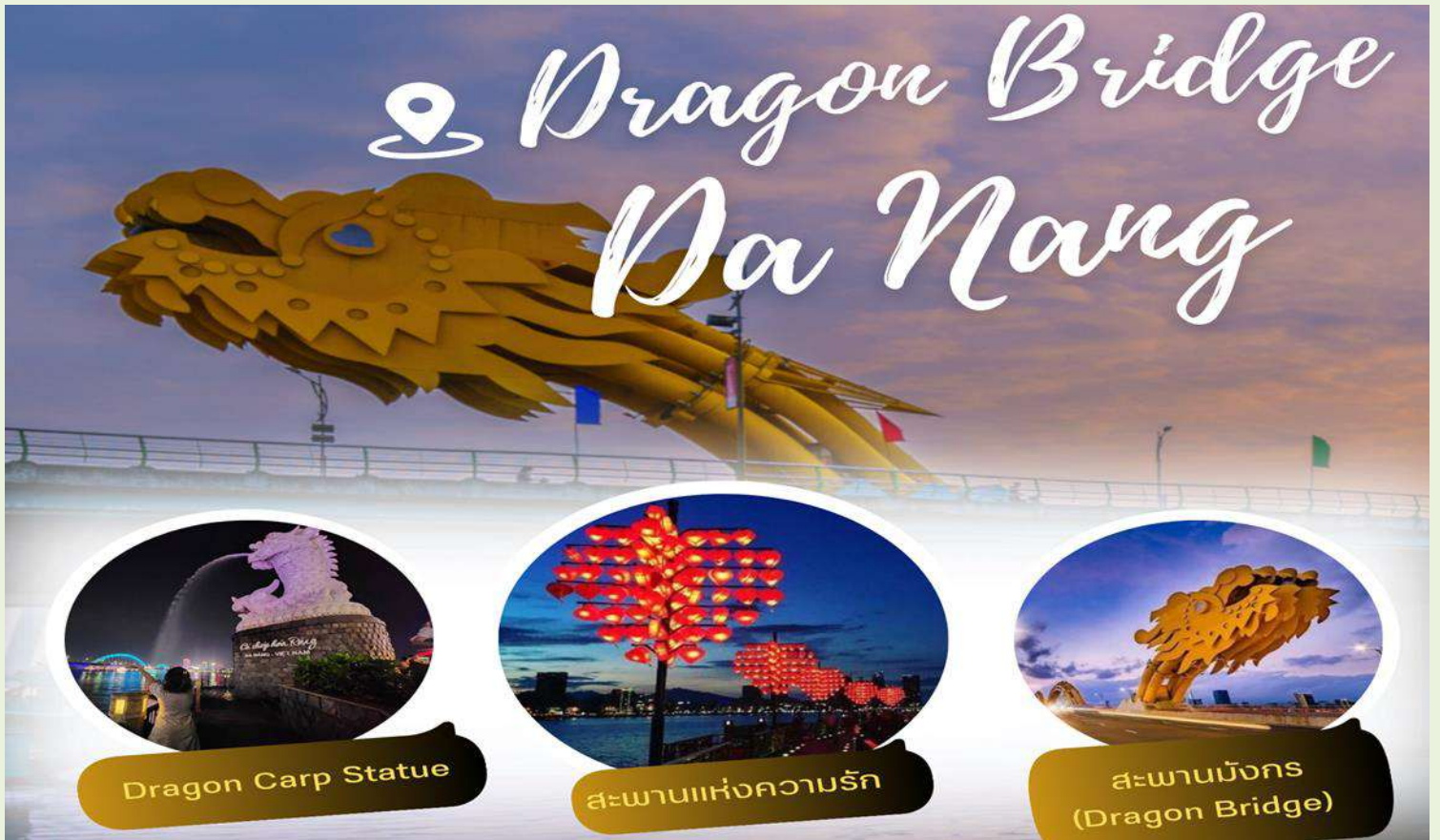
Dragon Carp Statue