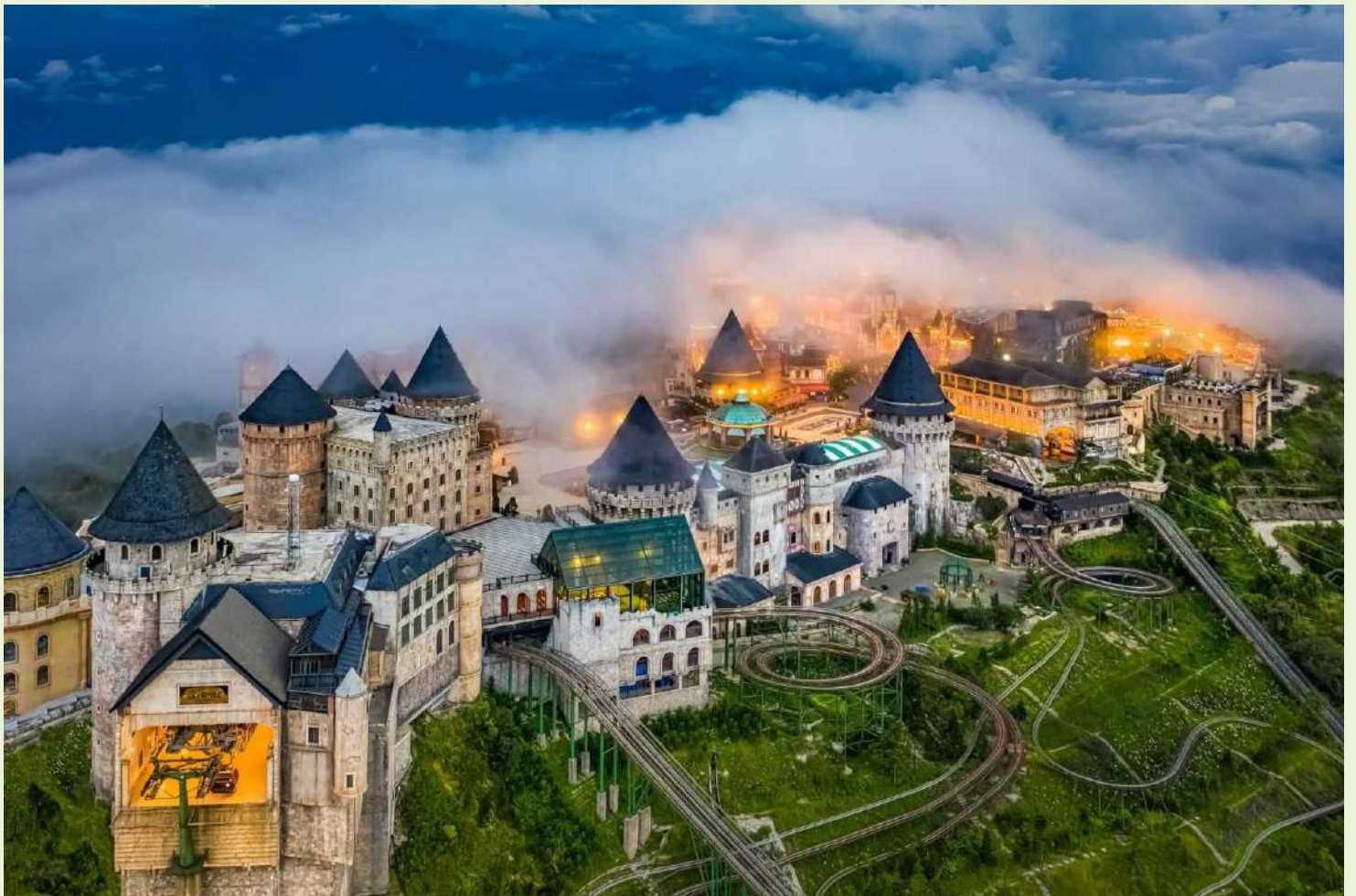
2UDAD-EK005 หลงเสน่ห์ เวียดนามกลาง ดานัง ฮอยอัน พั๊กบานาฮิลล์ 1 คืน (ไม่ลงร้านช้อปปิ้ง) 3 วัน 2 คืน โดยสายการบิน Emirates Airlines (EK)