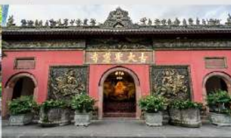
ภูเขาสี่ดรุณี (หุบเขาชวงเจียวโกว)