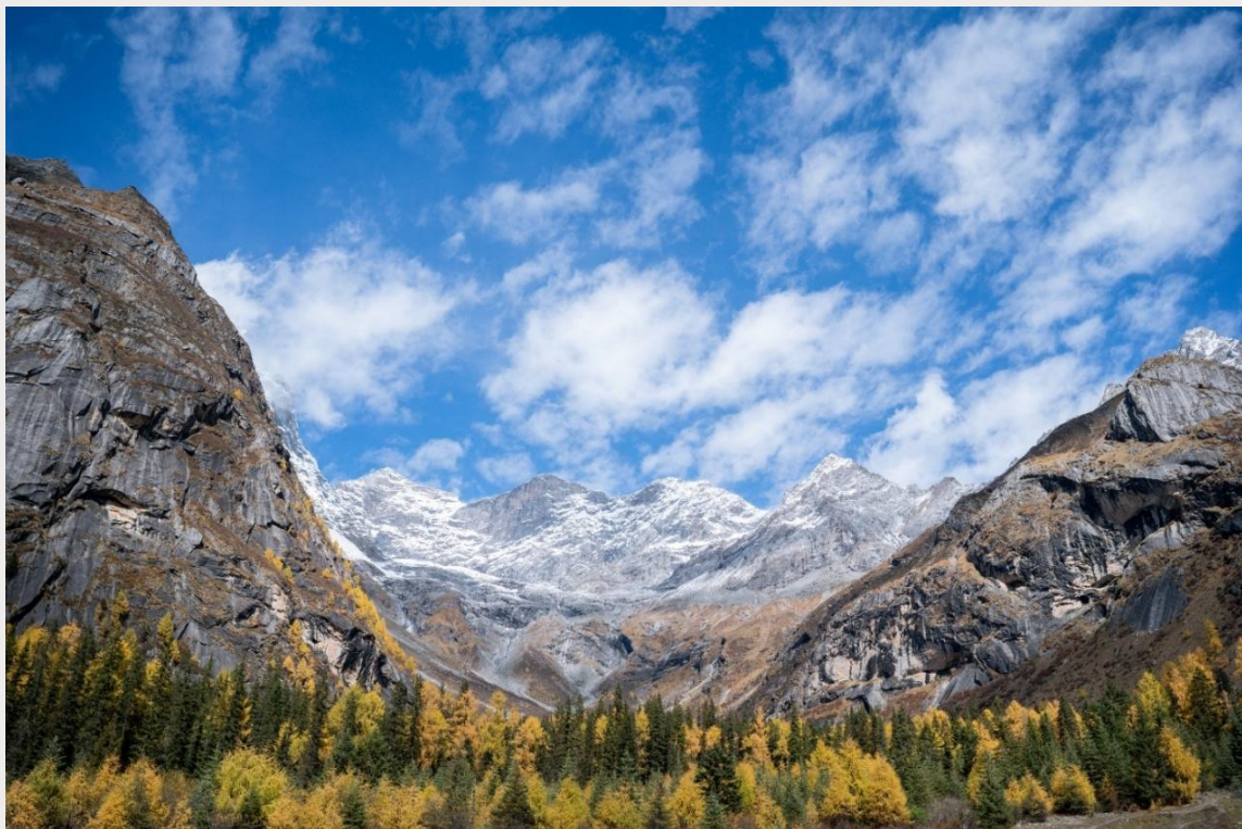
ฤดูใบไม้ร่วง (AUTUMN)