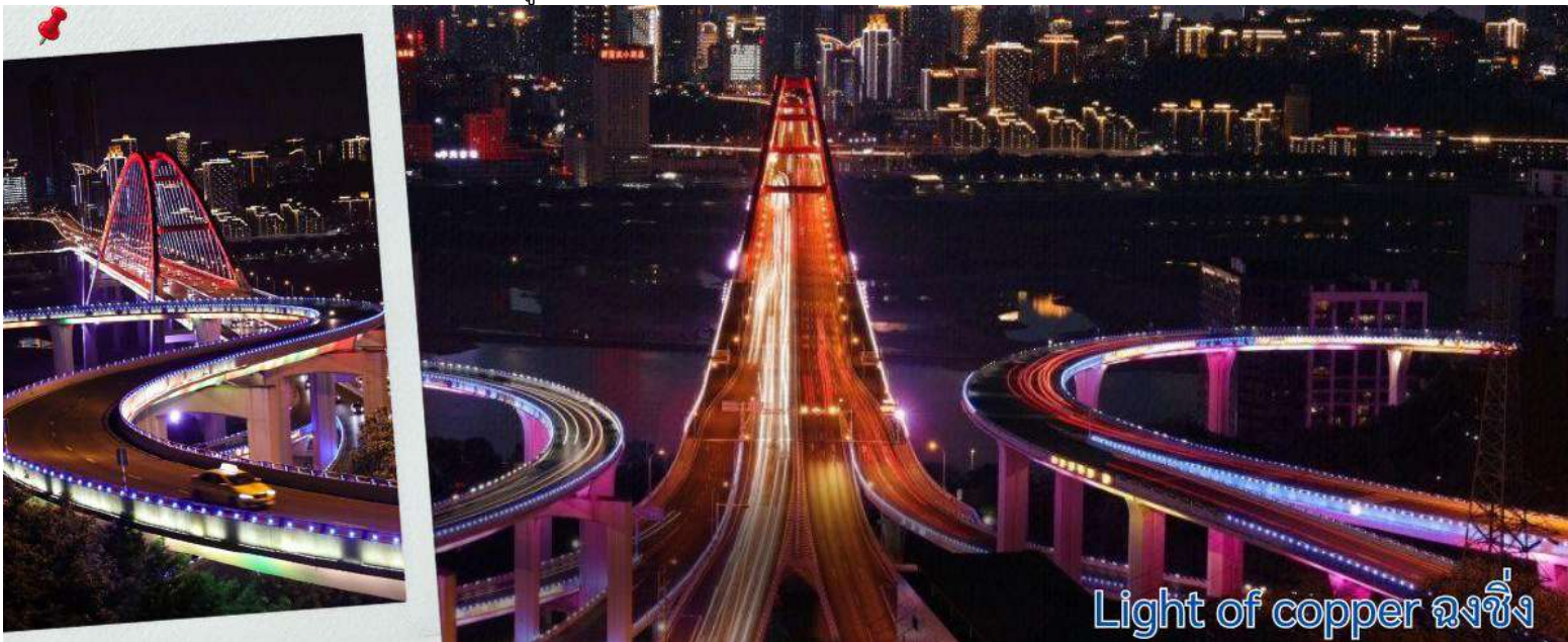
Light of copper ฉงชิ่ง

แนวถ่ายรูปวิวที่ Light of copper ฉงชิ่ง เป็นจุดชมวิวยอดนิยมชื่อดังในมหานคร ฉงชิ่ง ประเทศจีน ซึ่งได้รับความนิยมอย่างมากในกลุ่มนักท่องเที่ยวและช่างภาพ จุดชมวิวยางยกระดับโดดเด่นด้วยทางเดินลอยฟ้าทรงกลมที่เชื่อมต่อกันสามารถมองเห็นวิวพาโนรามาของ สะพานจูเจียปา (Sujiaba Interchange) ที่โค้งไปมาอย่างซับซ้อน และสะพานข้ามแม่น้ำแยงซีเกียง ไช่หยวนป่า (Caiyuanba Bridge) ท่ามกลางตึกสูงระฟ้าบรรยากาศยามค่ำคืน เมื่อเปิดไฟเมืองในช่วงค่ำจะเห็นแสงสีทองและสีทองแดงสะท้อนความงดงามของ "เมืองภูเขา" ได้อย่างชัดเจน