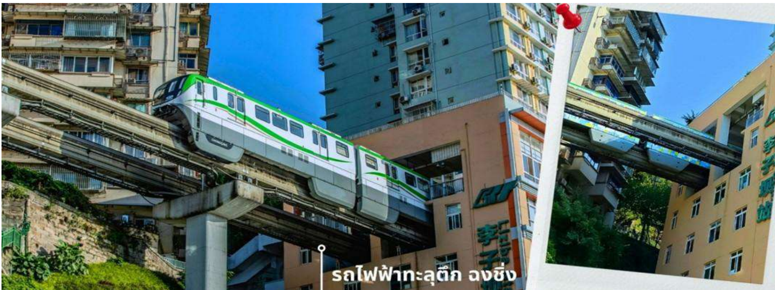
รถไฟฟ้าทะลุตึก ลงชิง

จากนั้นนำท่านนั่งรถไฟฟ้าทะลุตึก หรือ สถานี Liziba เป็นสถานีรถไฟฟ้าแบบขานชาลา สิ่งที่ทำให้สถานี Liziba มีชื่อเสียงไปทั่วโลกคือ “เส้นทางรถไฟที่วิ่งทะลุผ่านอาคารสูง 19 ชั้น” โดยมีระบบลดเสียงและแรงสั่นสะเทือน ทำให้ผู้ที่อาศัยอยู่ในตึกไม่ได้รับผลกระทบจากเสียงดังมาก กลายเป็นภาพอันน่าตื่นตาตื่นใจของผู้ที่มาเยือนทั้งนักท่องเที่ยวที่เดินทางมาเป็นครั้งแรก ผู้โดยสารบนขบวนรถไฟและผู้เข้าชมจากจุดชมวิวที่ต่างตื่นตันทึ่งไปตามๆกันกับการได้เห็นรถไฟวิ่งทะลุตึกนี้ สถานี Liziba ได้รับการยกย่องให้เป็น 1 ในสถานที่สำคัญที่สะท้อนความเติบโตของจีนตลอด 70 ปี ซึ่งไม่ได้เกิดขึ้นโดยบังเอิญ รถไฟฟ้าทะลุตึกนี้คือตัวอย่างของความอัจฉริยะในการออกแบบการคมนาคมในเมืองภูเขาแห่งนี้ให้ท่านได้สัมผัสประสบการณ์กับการขึ้นนั่งบนรถไฟเพื่อผ่านทะลุตึกและเก็บภาพบรรยากาศ