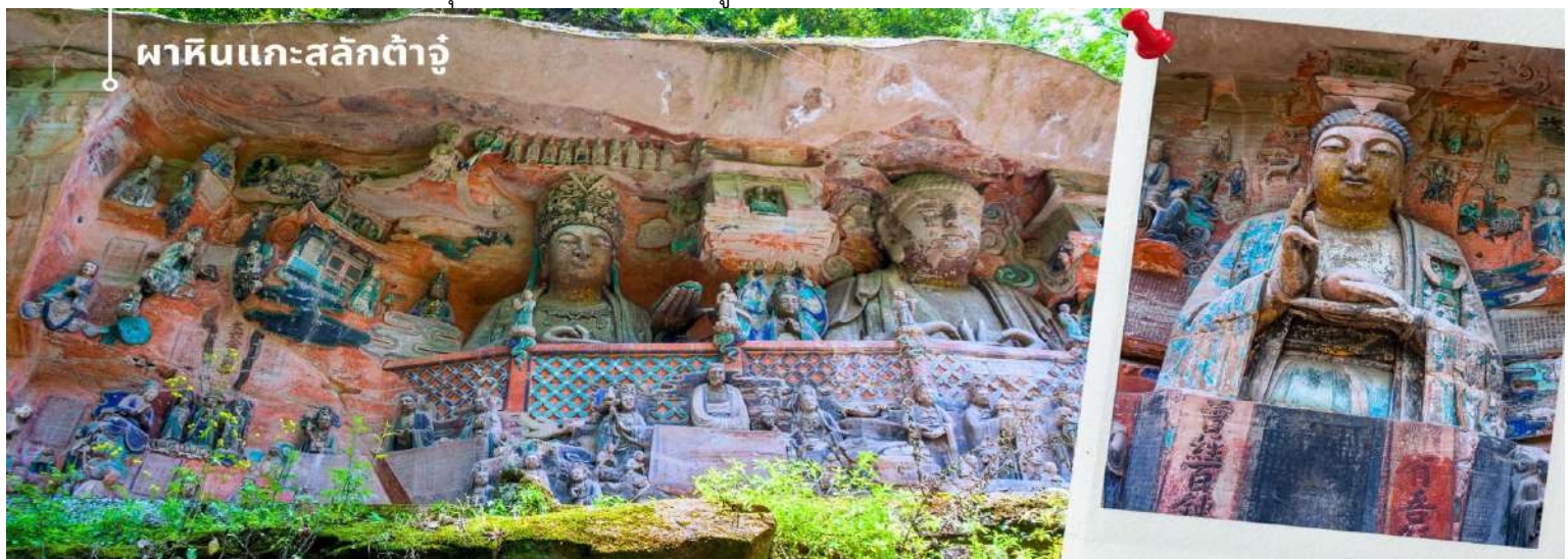
ผาหินแกะสลักต้าจู่

จากนั้นนำท่านเดินทางสู่ ผาหินแกะสลักต้าจู่ เขาเป่าตั้งซาน ผาหินแกะสลักที่ได้รับการบันทึกให้เป็นมรดกโลกทางวัฒนธรรม ที่ผสมผสานบนความเชื่อด้านศาสนาและเป็นงานศิลปะที่ผสมผสาน จุดเด่นของเมืองต้าจู่ที่แสดงถึงงานฝีมือในการแกะสลักถ้ำและผาหิน กลุ่มผาหินแกะสลักต้าจู่มีมากกว่า 70 จุด ซึ่งงานมากกว่า 1 แสนชิ้น ในนั้นถือว่า “เป่าตั้งซาน” และ “เป่ยซานม่อหย่า” สองสถานที่นี้มีหินแกะสลักชิ้นซื่อกมากที่สุด เน้นไปทางพุทธศาสนาเป็นแบบอย่างของถ้ำหินแกะสลักของประเทศจีนในยุคศิลปะตอนปลาย และ หินแกะสลักเป่าตั้งซาน เป็นตัวหลักในการขุดเจาะแกะสลักอย่างยากลำบากกว่า 70 กว่าปี หินแกะสลักที่นี้จะแกะตามรูปลักษณ์ของตัวภูเขา ด้วยความปราณีต และพิถีพิถัน มีความสวยงามเปรียบพร้อมด้วยเนื้อหอบอกเล่าและเตือนสติผู้พบเห็น และยังมีการจัดแบ่งงานฝีมือของแต่ละยุคไว้ เป็นการประชันของช่างในแต่ละยุค ด้านใต้จะเป็นงานในยุคถังตอนปลาย จนถึง ยุคห้ารัชกาล และ ด้านเหนือจะเป็นงานในสมัย ช่งเหนือซึ่งได้ ซึ่งงานฝีมือในแต่ละยุคจะสะท้อนความเป็นอยู่และค่านิยมที่ไม่เหมือนกัน