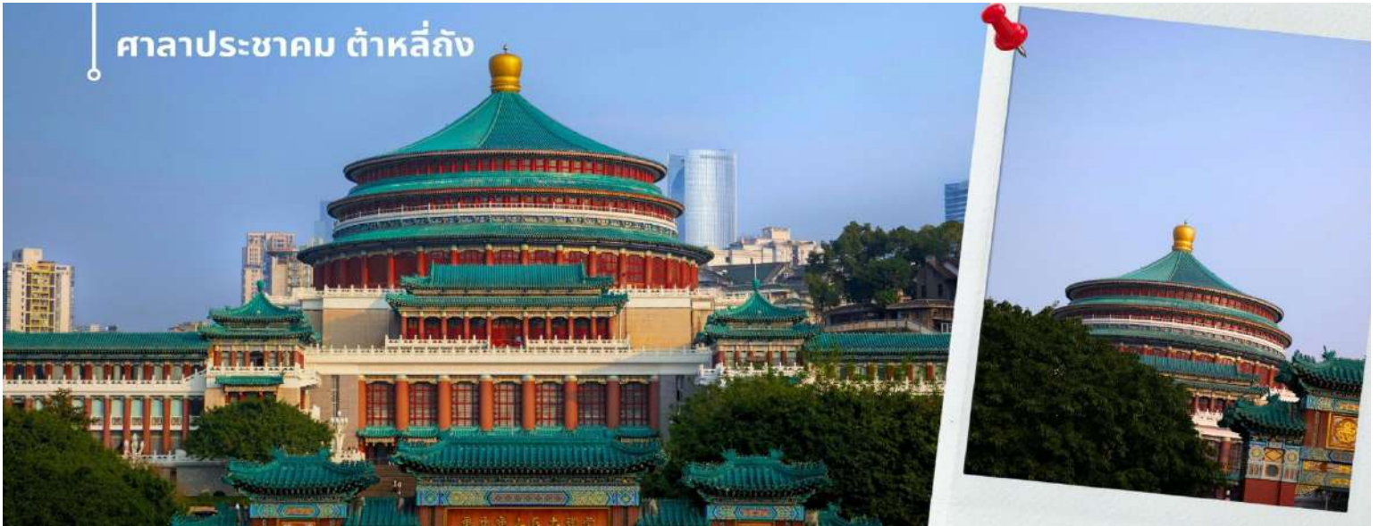
ศาลาประชาชน ต้าหลี่ถิง

ในตอนเย็นและตอนกลางคืนจะมีผู้คนจำนวนมากเข้ามารวมตัวกันทำกิจกรรม ไม่ว่าจะเป็นการเต้นแอโรบิค เดินเล่น ปิกนิก เดินชมแสงไฟยามค่ำคืน จัดนิทรรศการต่างๆ