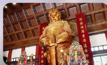
วัดกังหันแฆง