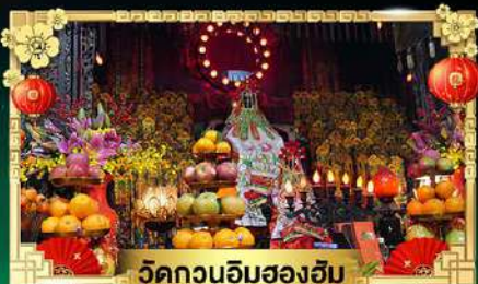
วัดกวนอิมสองอิม