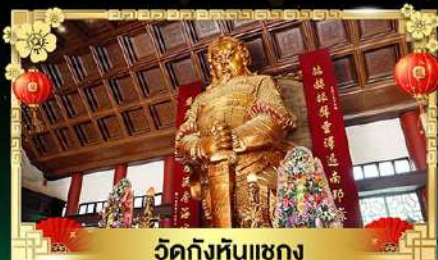
วัดกั๊งหันแซง