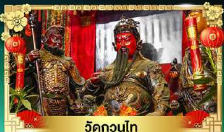
วัดกวนโถ