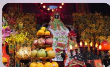
วัดกวนอิมสองฮิม