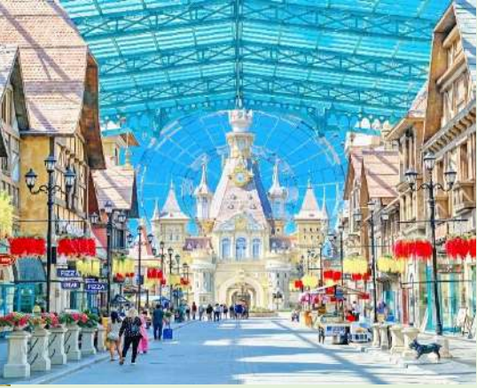
World, The Sea Shell, Typhoon World, European Streetmostphere