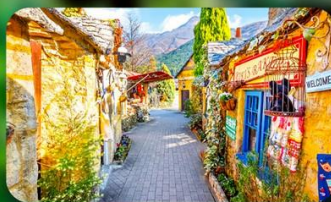
หมู่บ้านยูฟุอิน