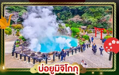
บ่อน้ำพุร้อน

ชมธรรมชาติแห่งคิอูชู 🇯🇵 แพคเกจชาวทาคาชิโอะ