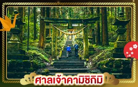
ศาลเจ้าคามิชิกิมิ