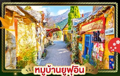
หมู่บ้านยูฟุอิน