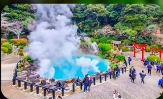
บ่อยูมิจิโกกุ