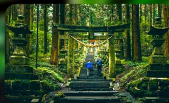
ศาลเจ้าคามิซึกิมิ