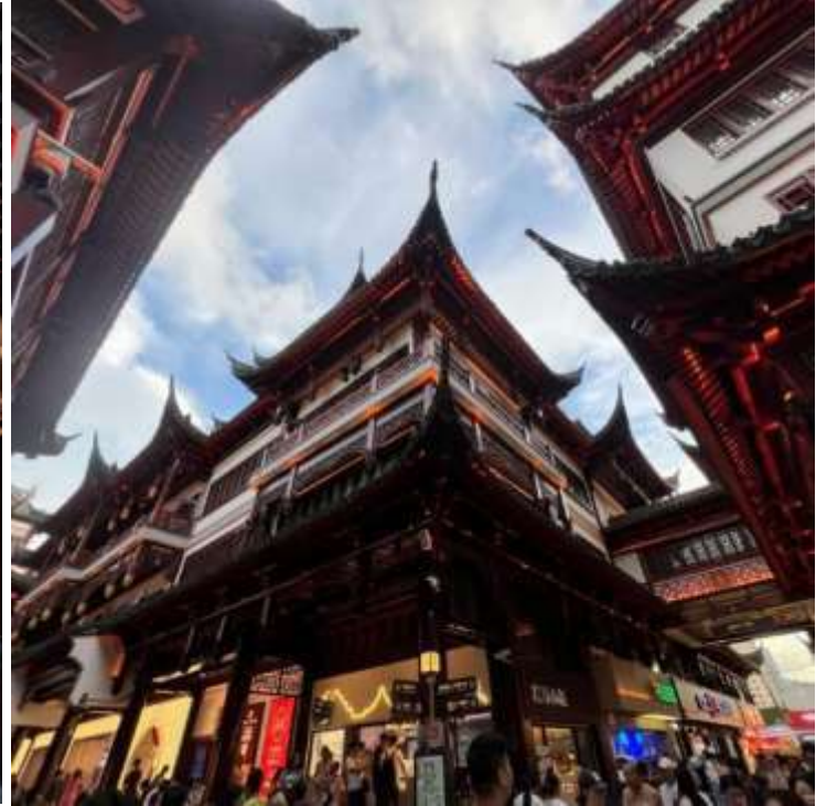
กลางวัน รับประทานอาหารกลางวัน ณ ภัตตาคาร (มือที่ 2)