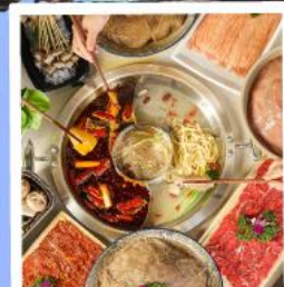
หม้อไฟหมาล่า