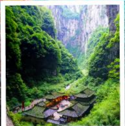
หลุมฟ้าสะพานสวรรค์