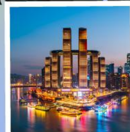
ตึกรูปฟีฟ่า