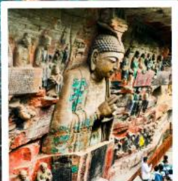
ฉาหินแกะสลักต้าจู้