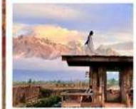
YUN DI AN CAFE