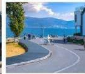
โค้ง S ทะเลสาบเอ่อไห่