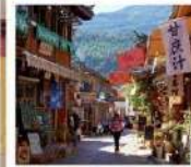
หมู่บ้านไปซา