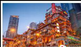
ตลาดแดงเซาตง