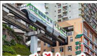
สถานีรถไฟทะเลสาบ

ชิง - อุ้งหล่ง - หงหยาดัง อุทยานเทมาบางฟ้าอึ้ง สถานีรถไฟทะเลสาบ หลุมฟ้าสามสะพานสวรรค์