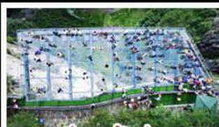
ระเบียงแก้วอุ้งหล่ง