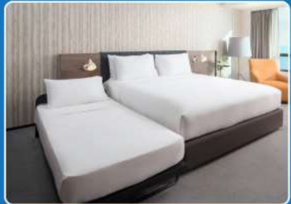
👤👤+👤 TRIPLE (TRP)

**รูปภาพห้องพักเป็นเพียงภาพสื่อถึงประเภทของเตียงเท่านั้น ไม่ใช่ภาพห้องพักจริงสำหรับการเข้าพัก**