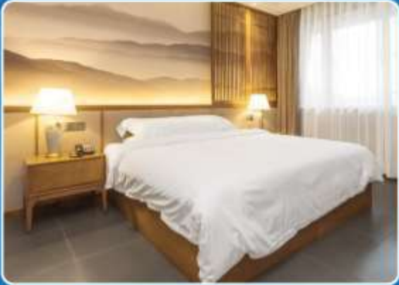
👤 SINGLE (SGL)