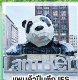
แพนด้าปิ่นตึก IFS