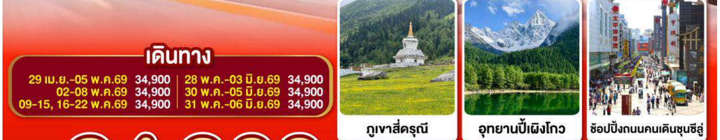
ภูเขาสี่ฤดู

ภูผาหิมะ-กลางเขียร์คำกู่ปิงชวน อุทยานจิวจ้ายโกว