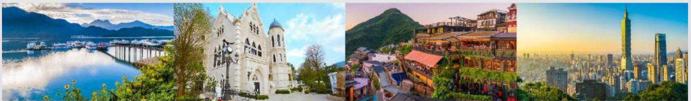
ล่องเรือทะเลสาบสุริยันจันทร