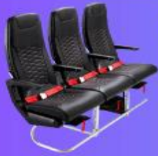
ที่นั่งมาตรฐาน

12.05 น. ออกเดินทางสู่ เมืองโอซาก้า ประเทศญี่ปุ่น โดยสายการบิน THAI AIR ASIA X (XJ) เที่ยวบินที่ XJ610