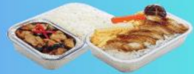
บริการอาหารร้อนบนเครื่อง ขาไป - ขากลับ