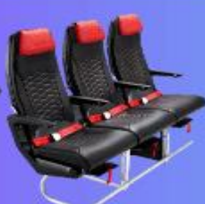
ที่นั่ง HOT SEAT