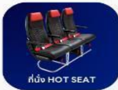
ที่นั่ง HOT SEAT