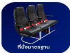
ที่นั่งมาตรฐาน