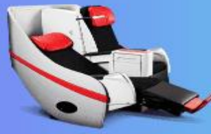
พรีเมียมเฟลตเบด