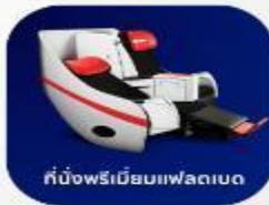
ที่นั่งพรีเมียมแฟลตเบด