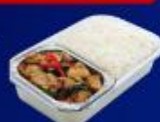
ข้าวทะเลเผาโรต