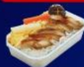
ข้าวหน้าไก่ย่างเขรยาค