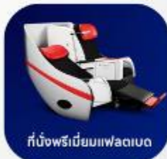
ที่นั่งพรีเมียมแฟลตเบด