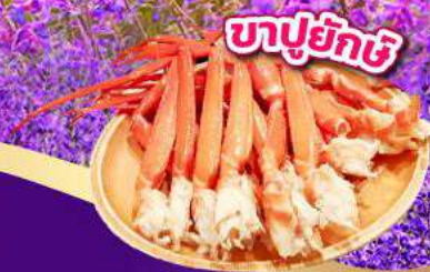
ซาปูยักษ์