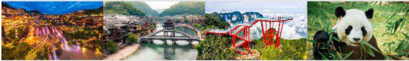
ฝูหลงเจิน