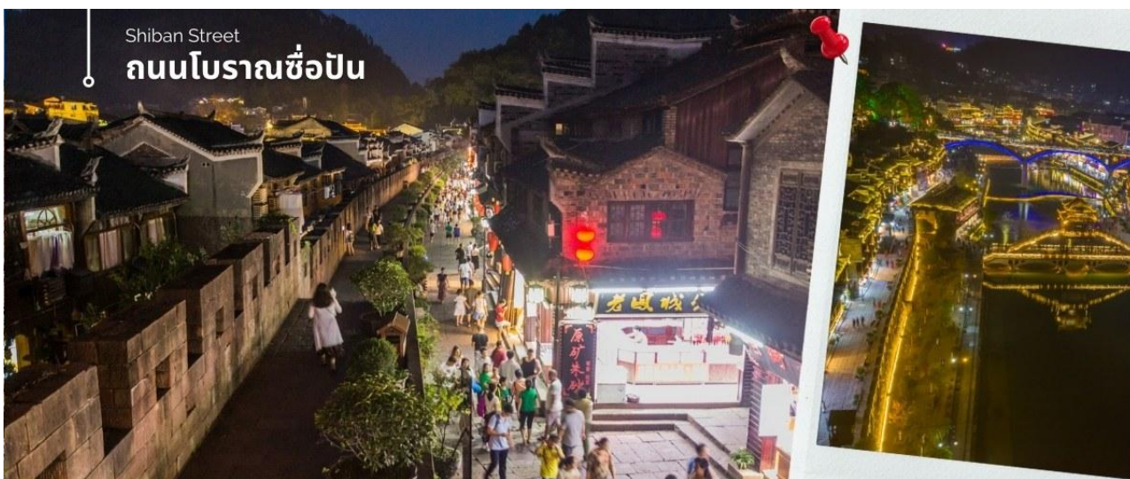
Shibans Street ถนนโบราณช้อปปิ้ง

ชมแสงสียามค่ำคินของเมืองเก่า จุดไฮไลท์ที่ขึ้นชื่อของเมืองแห่งนี้ จากนั้นนำท่านเดินเล่นชม เมืองโบราณเฟิ่งหวง ถนนคนเดินสายโบราณ ถนนช้อปปิ้ง Shibans Street เมืองที่ยังคงรักษาเอกลักษณ์ความเป็นพื้นเมืองผสมผสานกับยุคปัจจุบันเอาไว้ได้อย่างลงตัววิถีชีวิตของชาวบ้านที่อาศัยอยู่ที่นี่ บรรยากาศในเมืองเฟิ่งหวง บอกเลยว่าดีงามเหมาะแก่การมาพักผ่อน ใครที่กำลังมองหาสถานที่พักผ่อนจากการทำงาน ลองมาชมวิวยามค่ำคืน วิวบ้านริมน้ำ วิวสะพานของอร่อยน่าหลงประจักษ์ เดินชมบรรยากาศเมืองโบราณได้ทั้งกลางวันและกลางคืน หรือล่องเรือบนแม่น้ำถั่วเจียงชมบรรยากาศสองฝั่ง