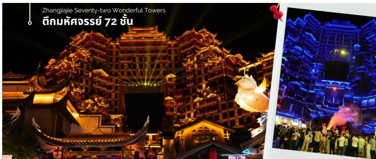
Zhangjiajie Seventy-two Wonderful Towers

หลังผ่านพิธีการตรวจคนเข้าเมือง และรับกระเป๋าสัมภาระเรียบร้อยแล้ว นำท่านเดินทางโดยรถโค้ชปรับอากาศเข้าสู่เมือง จางเจียเจี๋ย เป็นประตูดังดินแดนบริสุทธิ์ของโลก ตั้งอยู่ทางภาคตะวันตกเฉียงเหนือของมณฑลหูหนาน เป็นหนึ่งในเมือง ท่องเที่ยวที่สำคัญที่สุดมีชื่อเสียงทางด้านทรัพยากรการท่องเที่ยวที่มีเอกลักษณ์ของตนเอง ชมตึกมหัศจรรย์ 72 ชั้น จุด เช็กอินใหม่ล่าสุดของเมืองจางเจียเจี๋ย โดยการสร้างตึกในครั้งนี้เป็นการรวมเอาจุดเด่นของเมืองจางเจียเจี๋ยกับวัฒนธรรมการ สร้างบ้านเรือนของชาวพื้นเมืองเจียงมาวมารวมกันโดยอาคารสูงที่สร้างจำลอง เขาเทียนเหมินซานหรือประตูละคร และ บ้านยก พื้นโบราณที่เป็นบ้านพื้นเมืองของชาวฉู่เจีย ภายในบริเวณตึก 72 ชั้น ยังรวบรวม รีสอร์ท ร้านอาหาร สตรีทฟู้ด ร้านขายของ ที่ระลึก ที่ตกแต่งด้วยแสงสีสุดอลังการ ตั้งอยู่ใจกลางเมืองจางเจียเจี๋ย