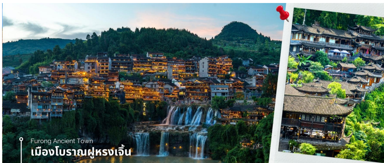
Furong Ancient Town เมืองโบราณฝูหรงเจิ้น

นำท่านเที่ยวชม เมืองโบราณฝูหรงเจิ้น เมืองโบราณเก่าแก่ที่ขึ้นชื่อ ของมณฑลหูหนานเป็นสถานที่ท่องเที่ยวระดับ AAAA ที่ได้รับความนิยมจากนักท่องเที่ยวคู่กับเมืองโบราณเฟิ่งหวง เคยเป็นสถานที่ถ่ายทำภาพยนตร์เรื่อง ฝูหรงเจิ้น ทำให้สถานที่แห่งนี้ยังได้รับความนิยมจากนักท่องเที่ยว จุดไฮไลท์ของเมืองโบราณแห่งนี้ นอกจากบ้านเรือนโบราณที่เป็นเอกลักษณ์เฉพาะของ