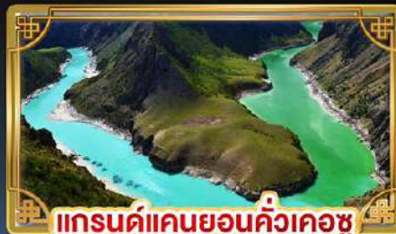
แกรนด์แคนยอนคั่วเคอซู