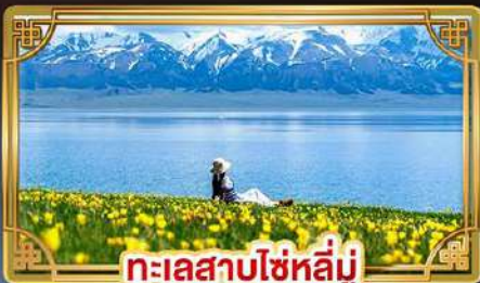
ทะเลสาบไซหลี่มู่