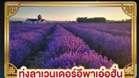
ทุ่งลาเวนเดอร์อีฟาอ้อฮั่น