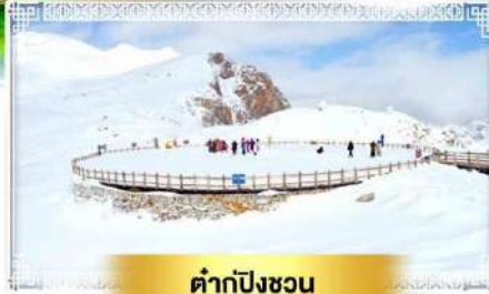
ต้ากู่ปิงชว่น