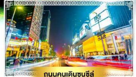
ถนนคนเดินชุนซีลู่