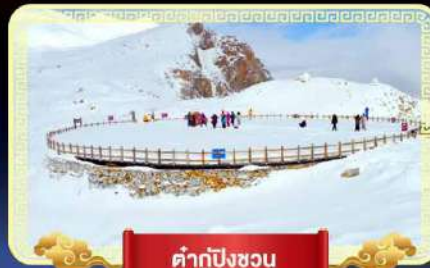
ต้ากู่ปิงชว่น