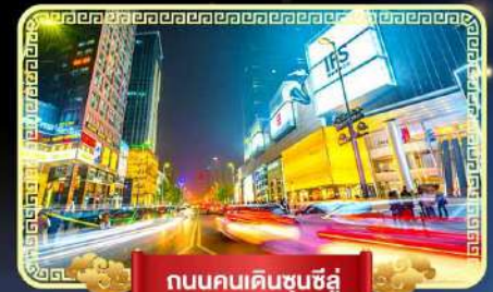
ถนนคนเดินชุนซีอู๋