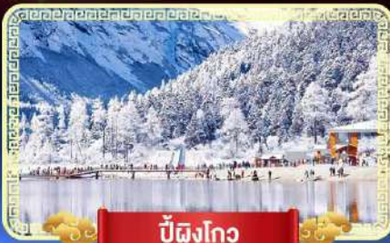
ปี้ผิงโกว

สัมปณีสวรรค์บนดินแห่งเมืองจีน เที่ยวสุดคุ้ม 3 อุทยานทางธรรมชาติ