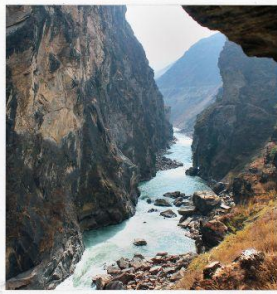
ช่องแคบเสือกระโดด