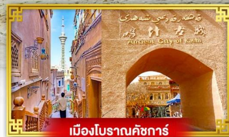
เมืองโบราณคัชการ์

เดินทางโดย : สายการบินโซนาเซาเทิร์นแอร์ไลน์