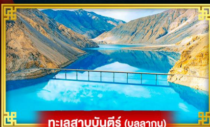
ทะเลสาบบันตีร์ (บลูลากูน)