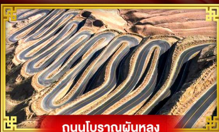
ถนนโบราณพันหลง

“คัชการ์” เกี่ยวสุดขอบตะวันตกประเทศจีน เมืองเก่าแห่งยุคเส้นทางสายไหมโบราณ