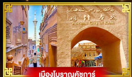
เมืองโบราณคัชการ์