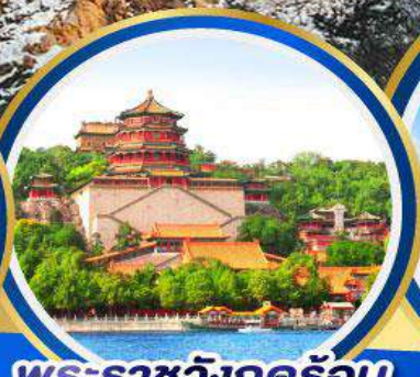
พระราชวังฤดูร้อน อิ๋ตงหยวน