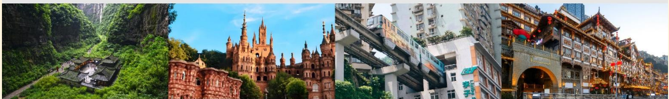
อุทยานแห่งชาติหลุมฟ้า 3 สะพานสวรรค์ Hua Sheng Yuan Dream Castle รถไฟฟ้าทะเลลึก หงหยาดิง

*ทางบริษัทฯ ขอสงวนสิทธิ์ในการสลับโปรแกรมทัวร์ตามความเหมาะสมขึ้นอยู่กับสถานการณ์หน้างาน โดยคำนึงถึงผลประโยชน์ของลูกค้าเป็นสำคัญ