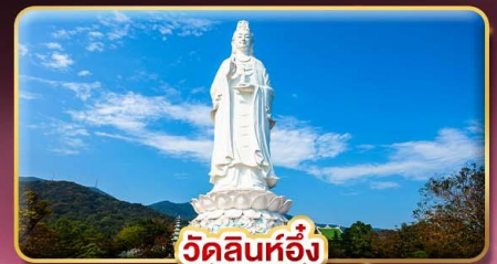
วัดลินห์ฮิ่ง