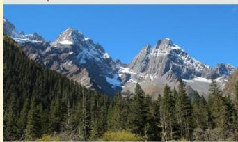
ภูเขาสี่ดรุณี (หุบเขาชวงเฉียวโกว)