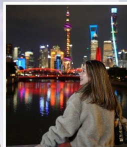
เซี่ยงไฮ้ คลาสสิก ไทท์