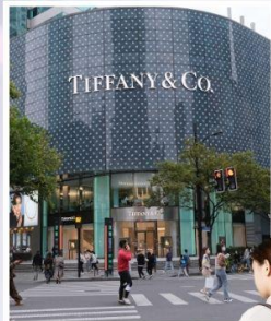
ถนนหวยไห่