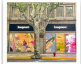
ถนนคนเดินหวยไห่

ขึ้นหอไข่มุก / ย่านลูเจียจู่ / เซี่ยงไฮ้ คลาสสิก ไนท์ สวนสนุกเซี่ยงไฮ้ดิสนีย์แลนด์เต็มวัน (รวมค่าเช่า) ท้องฟ้าจำลองเซี่ยงไฮ้ / SHANGHAI YAOXUE SNOW WORLD ซินเทียนตี้ / หมู่บ้านโบราณจูเจียเจียว + ล่องเรือ ถนนหวยไห่ / ซ้อปบิง Florentia Village Outlet