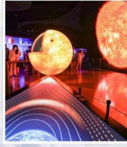
ท้องฟ้าจำลองเซี่ยงไฮ้