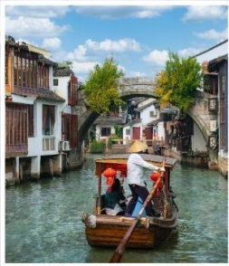
หมู่บ้านโบราณจูเจียเจี้ยว