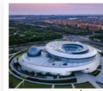
ท้องฟ้าจำลองเซี่ยงไฮ้