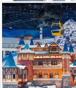
SHANGHAI YAOXUE SNOW WORLD